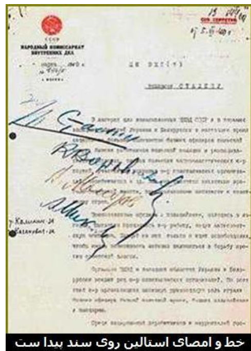
خط و امضای استالین روی سند پیدا ست

نامه بریا، امضای مولوتوف، وروشیلوف، کالینین، میکویان و کاگانوویچ (اعضای دفتر سیاسی حزب کمونیست شوروی) و بازجویانی چون کوبولف، مرکولف و باش‌توکف، را نیز دارد. در این نامه همه بکشتن اسرا و به قول خودشان «دشمنان خلق» Враги народа (وراگی نارودا)، موافقت می‌کنند و استالین بر تصمیم آنها (یعنی اعدام اسیران) مهر تأیید می‌زند. امضای استالین روی صفحه اول نامه موجود است.